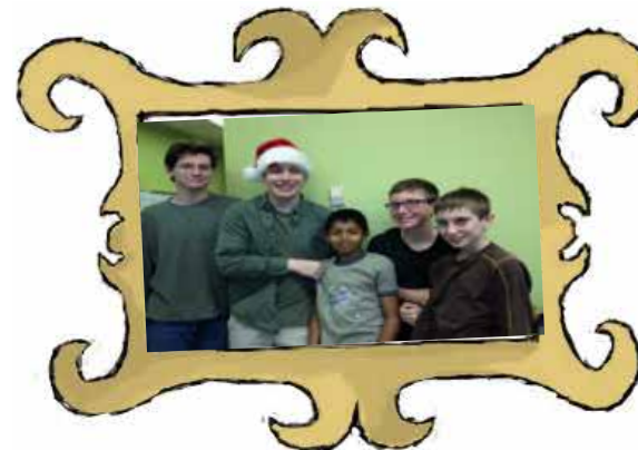
ARRC – Jeunesse de l'école L.P.P.

"Si tout le monde posait un petit geste aujourd'hui, ça changerait beaucoup de choses pour demain."